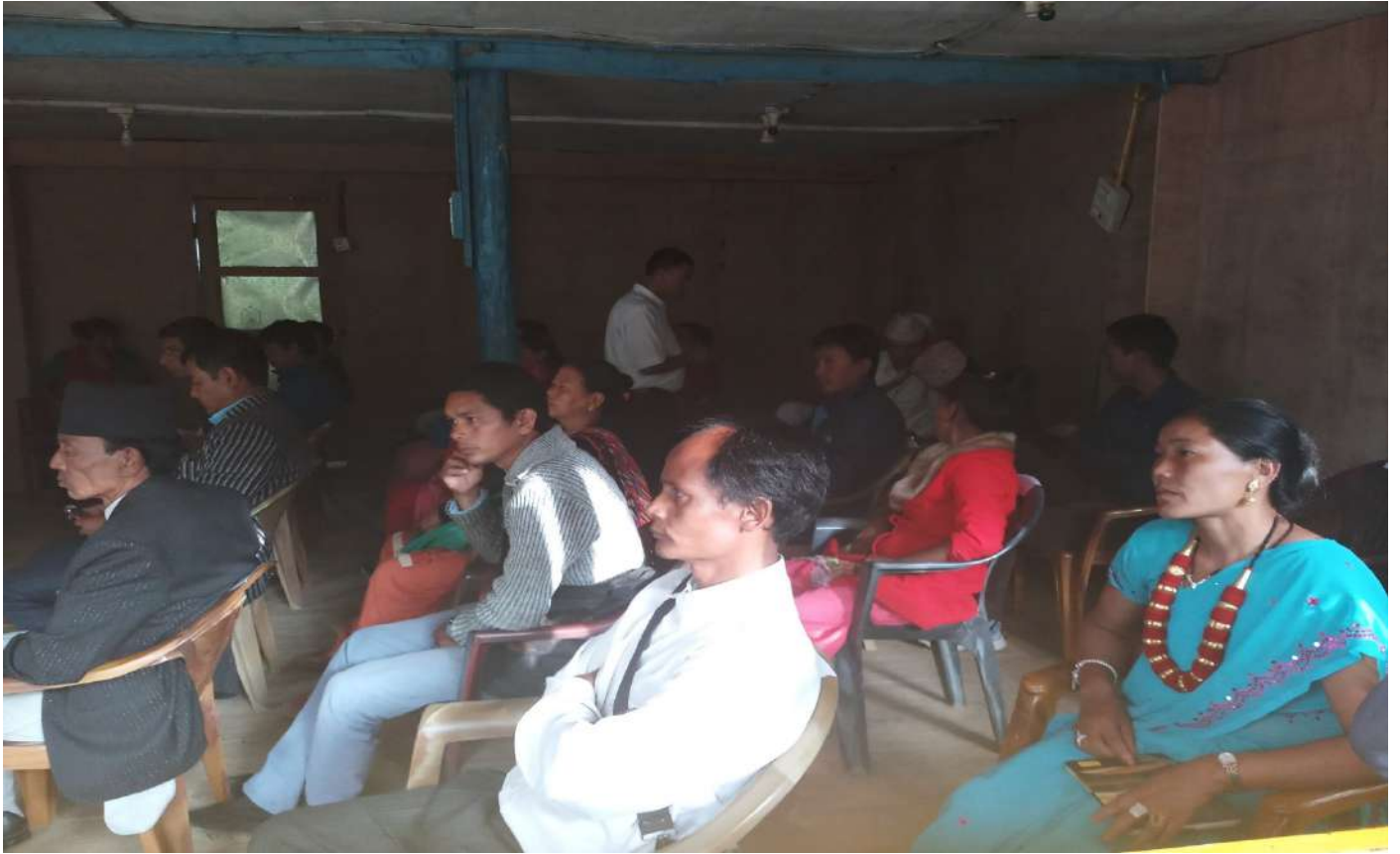
चित्र ३, फेदाप गाउँपालिकाको ऐतिहासिक प्रथम गाउँसभामा सहभागी सम्मानित सदस्यज्यूहरु