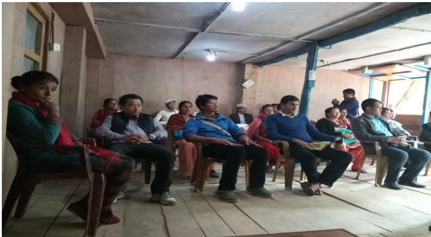
चित्र १ — सम्मानित गाउँसभाका सदस्य ज्यूहरू

अनुसुची: १३ - नीति, कार्यक्रम तथा वजेट सार्वजनिकीकरण समारोहका केही तस्वीरहरू